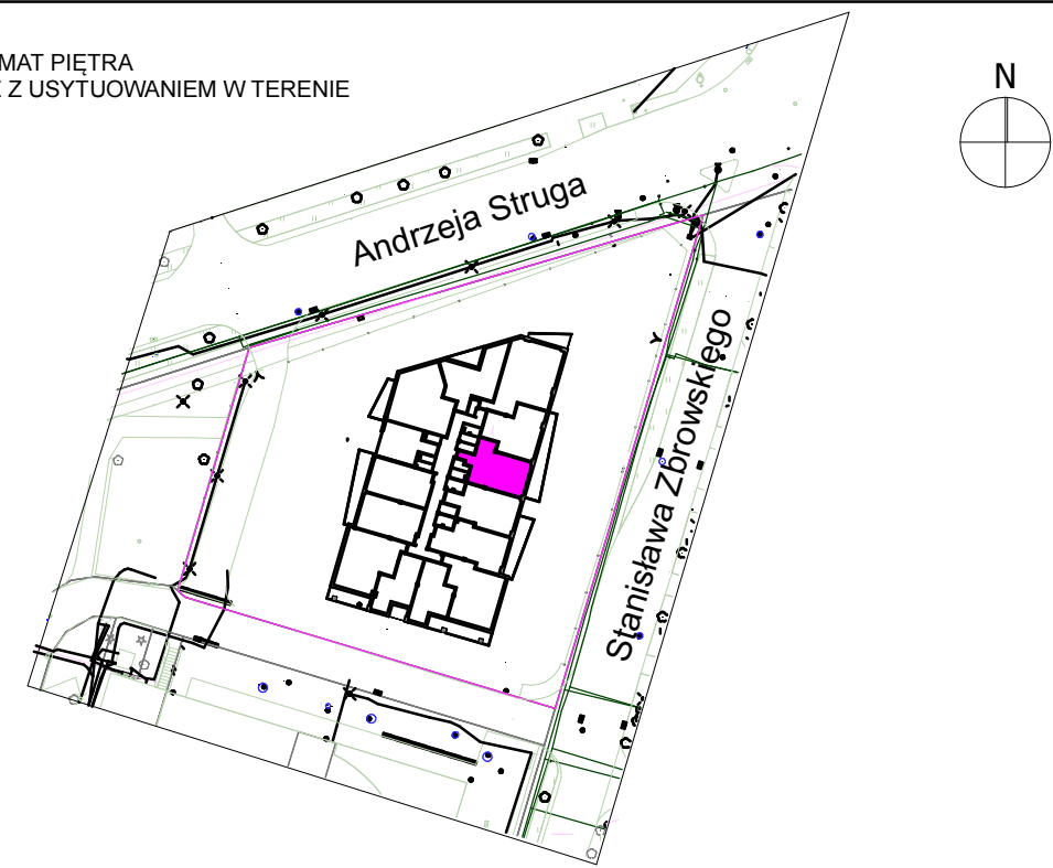
SCHEMAT PIĘTRA WRAZ Z USYTUOWANIEM W TERENIE